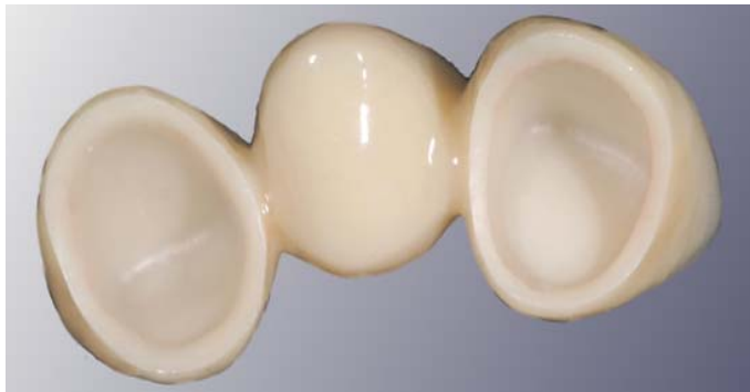
Frontzahnbrücke mit Zirkongerüst.