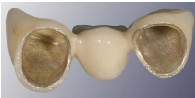
Klassische Frontzahnbrücke mit Metallgerüst aus Gold.