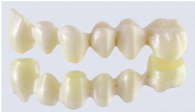
Zirkongerüst zur Verblendung mit Keramik.

Zirkonoxid lässt sich in Nuancen einfärben und ist somit farblicher Bestandteil des künstlichen Zahnes, mit bislang nicht erreichbarer optischer Wirkung.